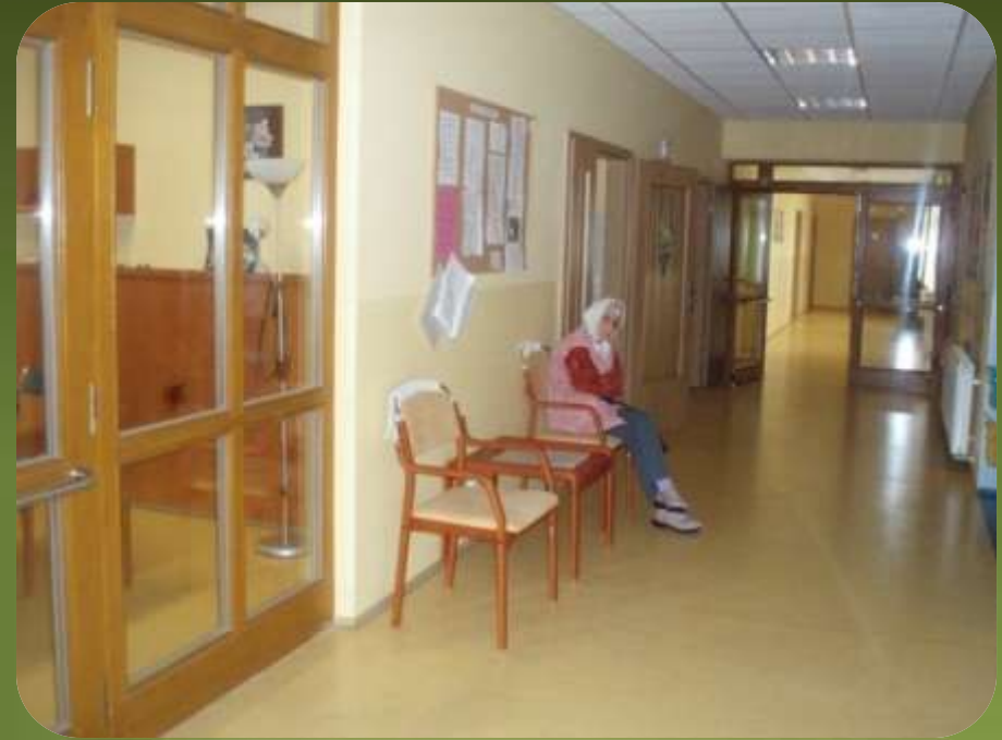
Hlavní chodba, kde rády pozorujeme dění na našem domečku