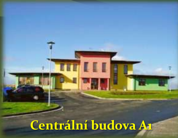
Centrální budova A 1