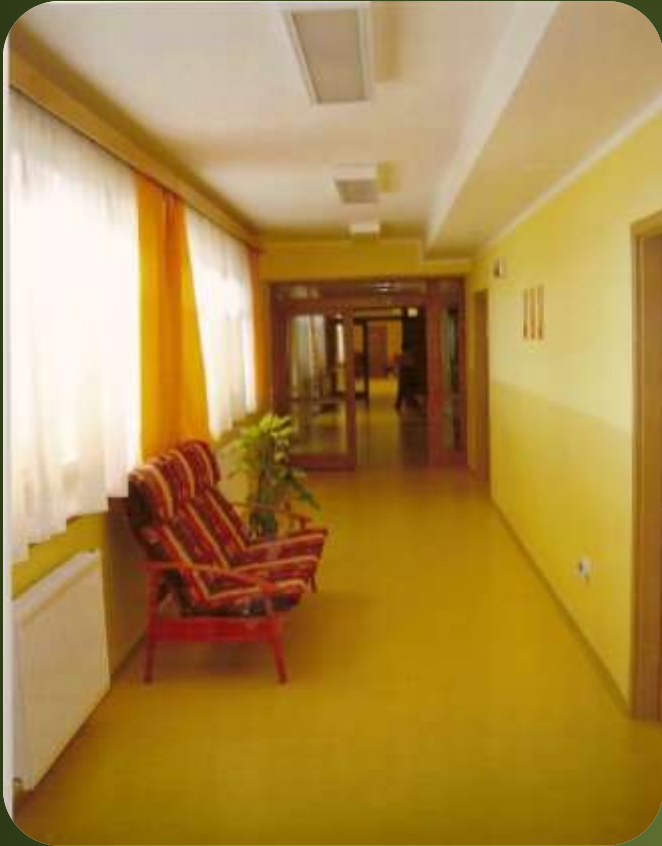
Chodba , která vede k našim pokojům