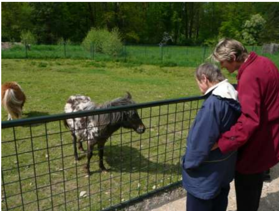
Zámek Nové Hrady