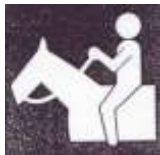
jízda na koni

Od letošního jara si můžeme zajezdit na koni u sousedů.